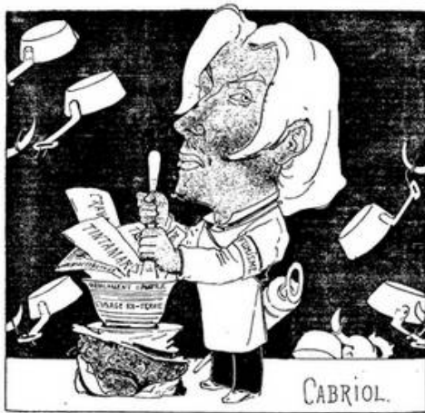
L'HYDROPATHE ALPHONSE ALLAIS

Evitons, d'entrée de jeu, la considération quasi-obligatoire, dans ce genre de cas, portant sur les forces et les faiblesses d'un dictionnaire ou d'un dictionnaire encyclopédique. Nous y reviendrons plus tard, à propos de cet ouvrage qui remplit précisément ce rôle de vouloir permettre à ses lecteurs de situer tel ou tel mouvement artistique et littéraire dans le temps, dans l'espace, dans ses auteurs et dans son contenu.